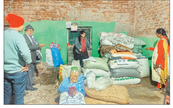
कार्रवाई करती टीम।

जिला चिकित्सालय में पदस्थ कथित महिला चिकित्सक द्वारा सेवा के विपरीत गैर जिम्मेदाराना आचरण के कारण गर्भवती महिला एवं उसके परिजन को कष्ट एवं मानसिक परेशानी उठानी पड़ी, जिसके संबंध में जिला चिकित्सालय के अस्पताल अधीक्षक को भी जानकारी है तो ऐसी गंभीर लापरवाही बरतने वाली कथित महिला चिकित्सक पर क्या कार्रवाई होती यह तो बाद में पता चलेगा, लेकिन इस तरह की संवेदनहील मामले की पुनरावृत्ति न हो इसके लिए निश्चित ही कड़ी कार्रवाई होनी चाहिए।