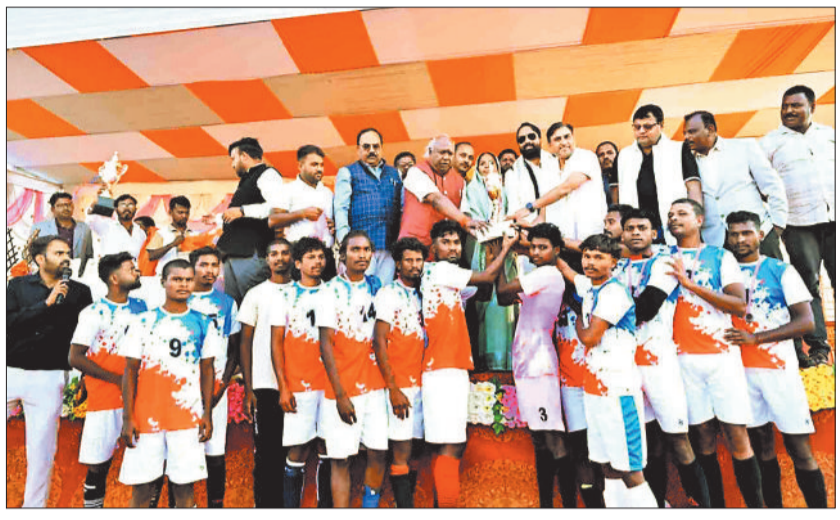
विजेता टीम को पुरस्कार देते सांसद व अन्य।

कर टास्क कराया खेल की शुरुआत की। इस बीच उपस्थित सभी खिलाड़ी एवं दर्शक से भेंट मुलाकात करते हुए दूर दूर से आए हुए ग्रामीण क्षेत्रों की जनता के बीच बैठकर उनका का हाल चाल पूछा। खेले गए फाइनल मुकाबला में ग्राम पंचायत गोपातु एवं ग्राम पंचायत शाहपुर के खिलाड़ियों ने शानदार फुटबॉल खेल का प्रदर्शन किया। हालांकि शाहपुर की टीम ने शुरुआत से ही