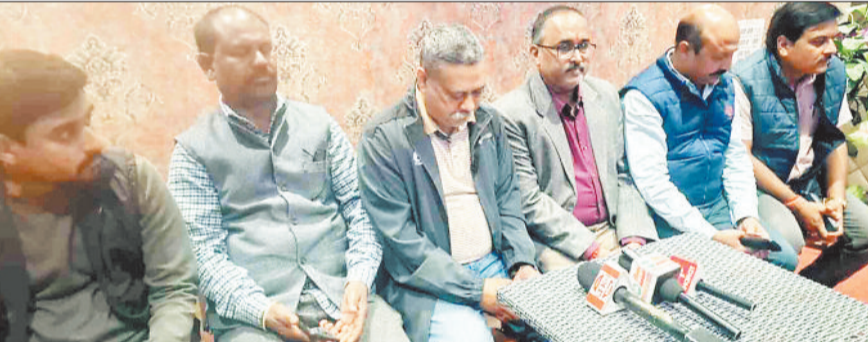
पत्रकारों से चर्चा करते हुए महापौर।