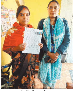
घर-घर पहुंचती बीएलओ।

जिले में विधानसभा निर्वाचन क्षेत्रों की मतदाता सूची के विशेष प्रगाढ़ पुनरीक्षण (एसआईआर) का कार्य तीव्र गति से आगे बढ़ रहा है। 4 नवंबर से शुरू हुए इस अभियान के तहत बैकुण्ठपुर, सोनहत, पटना एवं पोड़ी-बछरा तहसीलों में 298 बूथ लेवल अधिकारी (बीएलओ) घर-घर जाकर गणना प्रपत्रों का वितरण कर रहे हैं। इस दौरान एसडीएम, तहसीलदार एवं अन्य राजस्व अधिकारी भी बीएलओ के साथ फील्ड में पहुंचकर कार्य की निगरानी कर रहे हैं।