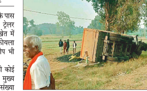
कि सोमवार की दोपहर ट्रेलर वाहन क्रमांक लोडकर विश्रामपुर की तरफ आ रहा सीजी 10 डीएन 5609 का चालक कोयला था, तभी विश्रामपुर-मानी मुख्य मार्ग पर

ग्राम कुरवां - डेडरी रोड स्थित पुल के पास आज सोमवार को कोयला लोड ट्रेलर अनियंत्रित होकर सड़क किनारे खेत में पलट गया है, साथ ही एक और कोयला लोड ट्रेलर गायत्री खदान के समीप भी पलट गया है। दोनों दुर्घटना में किसी तरह की कोई जनहानि की खबर नहीं है, इसका मुख्य कारण कोल ट्रांसपोर्ट की ट्रिप संख्या बढ़ाने के लिए चालकों के द्वारा जल्दबाजी बरतने को बताया जा रहा है, गौरतलब है