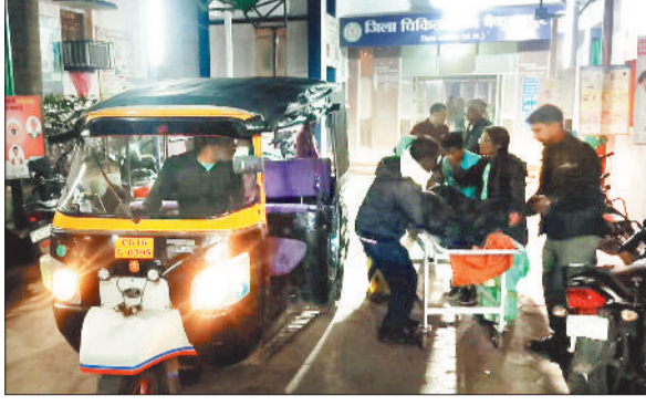
रात्रि में आटो से ले जाते परिजन।